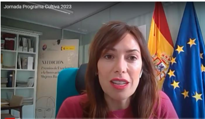
Foto1: Inauguración de la Jornada Programa CULTIVA 2023 por Carolina Gutiérrez Ansotegui, subdirectora general de Dinamización del Medio Rural (MAPA).

El día 8 de noviembre tuvo lugar la Jornada Programa CULTIVA 2023. Para esta jornada se convocó, especialmente, a las personas jóvenes profesionales agrarias, pero también a todas las instituciones, organizaciones y entidades públicas o privadas relacionadas con el relevo generacional y la incorporación de jóvenes a la actividad agraria.